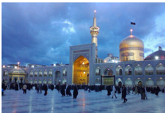
شکل شماره ۵: مشهد