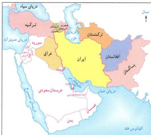
شکل شماره ۱: نقشه ایران و همایگان

روش تحقیق توصیفی-تحلیلی است و نویسندگان در این مقاله با بررسی بسترهای تاریخی، اجتماعی و فرهنگی عراق درصددند با تحلیل راهکارهای حضور موثر ایران در جامعه مذهبی عراق بتوانند فرصت‌های موجود در این کشور جهت تحقق حداکثر منافع ملی ایران را تبیین کنند.