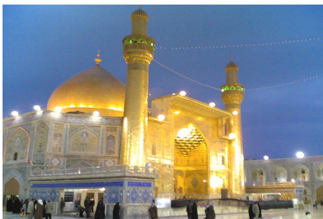
شکل شماره ۴: نجف