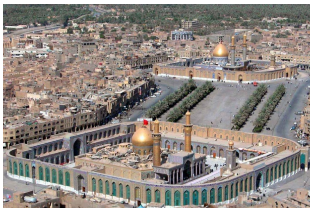
شکل شماره ۳: کربلا