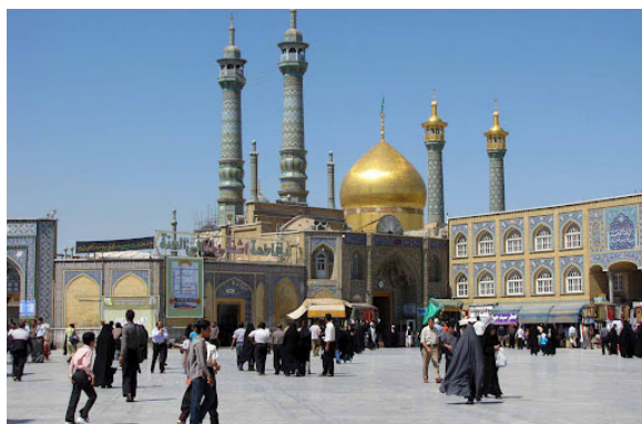
شکل شماره ۶: قم