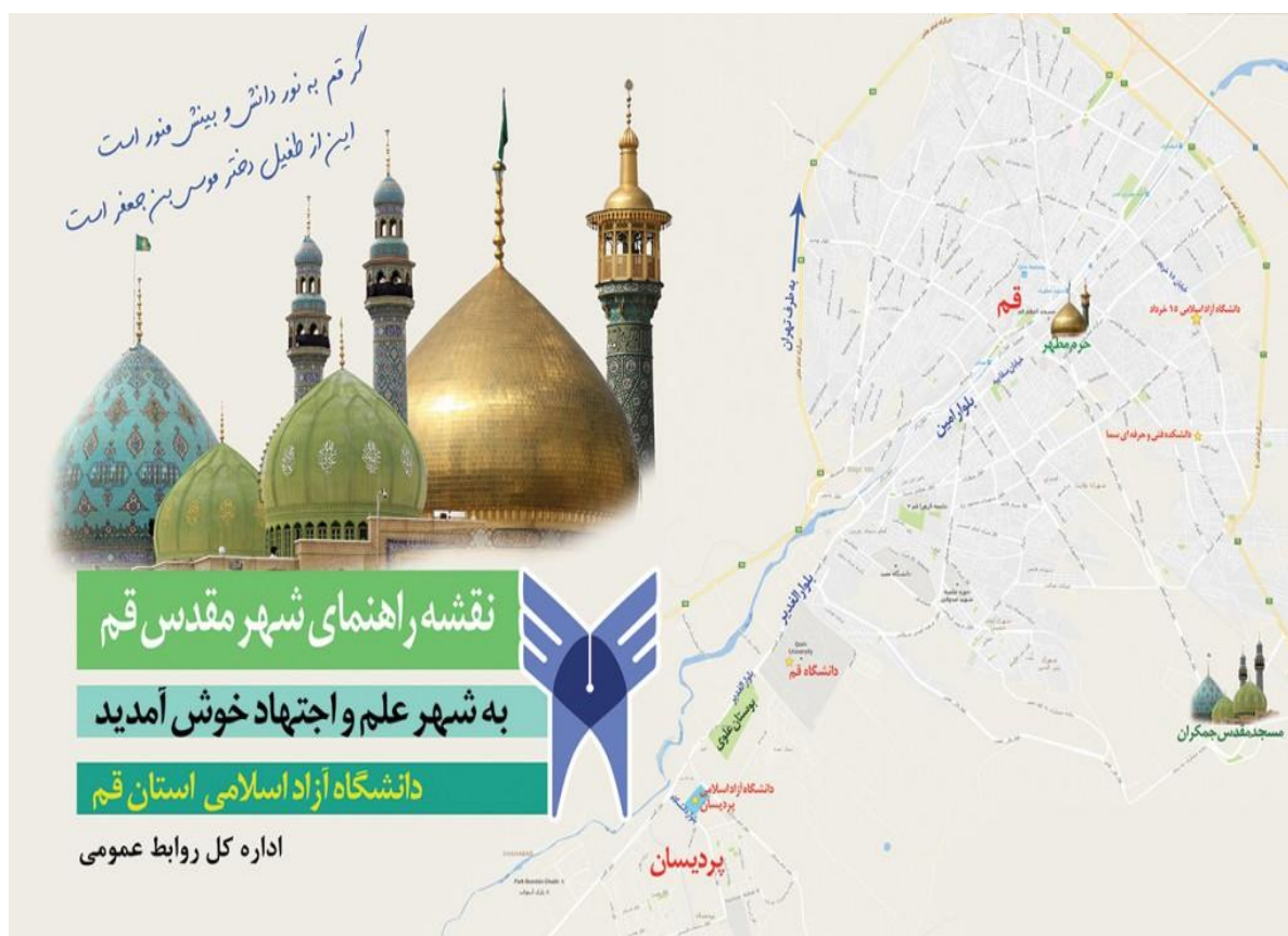
نقشه ۱: راهنمای شهر قم