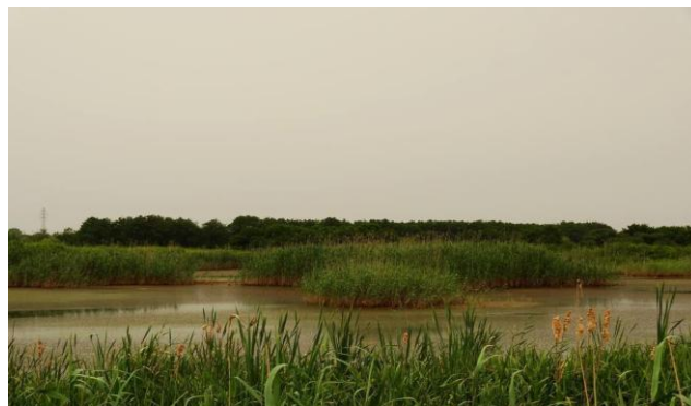
تصویر شماره ۲: گونه‌های گیاهی تالاب انزلی

حوضه‌ی تالاب انزلی با مساحت تقریبی ۳۴۱۰ کیلومتر مربع دارای حداکثر ارتفاعی در حدود ۳۱۰۵ متر در کوه‌های البرز در جنوب و حداقل ارتفاعی در حدود ۲۸ - متر در محل اتصال خود به دریای خزر دارد (پل غازیان). حوضه‌ی تالاب انزلی از نظر ژئومورفولوژی به دو نوع از شکل‌های زمین تقسیم می‌شود. دشت‌های پهن و زمین‌های پست در شمال و نواحی کوهستانی در جنوب دشت‌ها، دشت‌ها و زمین‌های پست دشت انزلی نامیده می‌شوند که بطور تقریبی ۶۰ کیلومتر پهنا (۴۰ - ۶۰) کیلومتر درازا دارد. نواحی کوهستانی نیز تقریباً ۷۰ کیلومتر پهنا و ۲۵ کیلومتر درازا دارند. دشت انزلی و نواحی کشاورزی پایین‌تر از ۱۰۰ متر شیب طبیعی کم‌تر از یک درصد است. که در نواحی کوهستانی بالاتر از ۲۵۰۰ - ۳۰۰۰ درصد می‌رسد (Jaeika, 2003).