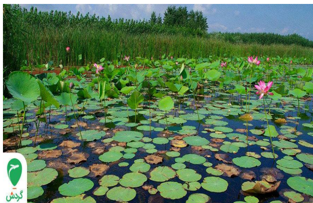
تصویر شماره ۱: تالاب انزلی

لحاظ تمرکز جمعیتی یکی از متراکم‌ترین شهرهای ایران است که در فاصله ۴۰ کیلومتری از رشت (مرکز استان گیلان) قرار دارد و تا تهران ۳۸۰ کیلومتر فاصله دارد.