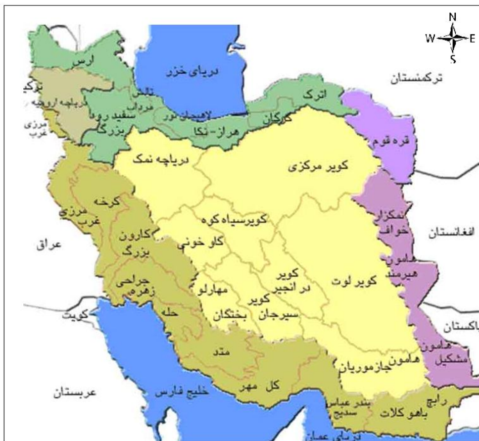
نقشه شماره ۲: حوضه‌های آبریز اصلی ایران

حوضه سرخس وجود دارد (نقشه شماره ۲). در اینجا از بین حوضه‌های مذکور به ویژگی‌های دو حوضه آبریز مرکزی و خلیج فارس و دریای عمان اشاره می‌شود.