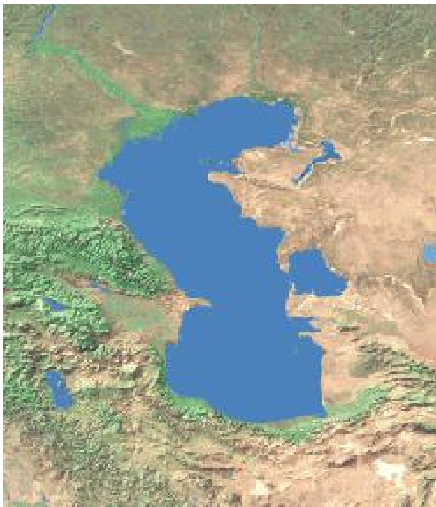
نقشه شماره ۱: پراکنش جغرافیایی اقوام در استان خوزستان