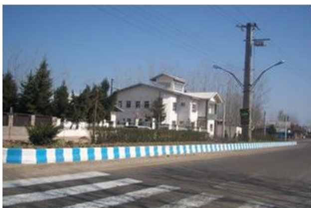
شکل شماره ۴: شکل‌گیری بافت اداری و معابر عمومی شهر رودبند

Source: Guide Plan of Roudbaneh, 2003. Comprehensive and detailed plan of Roudbaneh town, 2015.