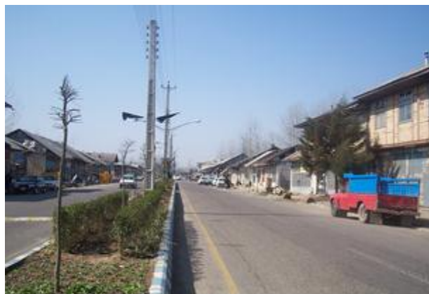
شکل شماره ۳: شکل‌گیری بافت تجاری و معابر عمومی شهر رودبند